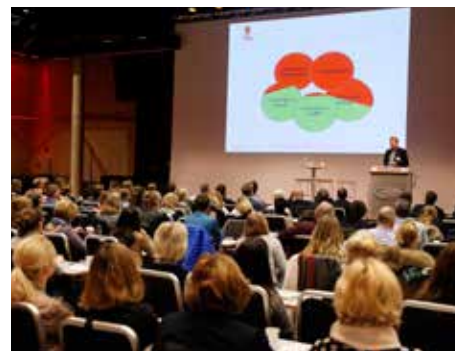
FULL SAL: Oslo Kongressenter var fullsatt med representanter fra næringslivet.

I løpet av dagen ble det holdt en rekke foredrag. Hva som skjer på grensen med utfordringene ved Svinesund og Ørje, Toll-etaten – veien videre og vareeiers ansvar var noen av temaene. ■