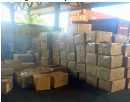
KASSER: Kassevis med beslaglagte varer i Guatemala.

met i 10 år, har han fortsatt permisjon fra Tollvesenet. I FN får man bare kontrakt ett år av gangen, og framtiden til programmet er avhengig av støtte fra donorer. Foreløpig ser det positivt ut med tanke på videre finansiering, men ingenting er sikkert.