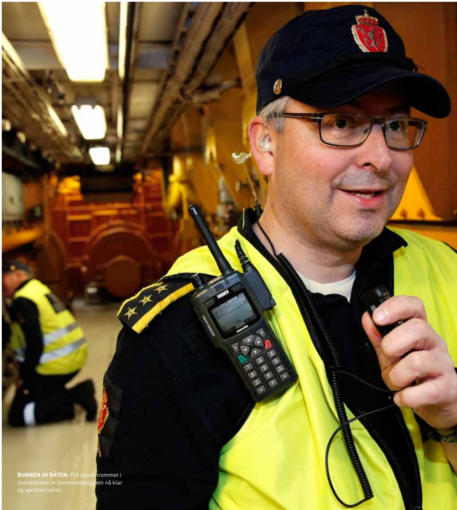
BUNNEN AV BÅTEN: Frå maskinrommet i danskebåten er kommunikasjone nå klar og uproblematisk.