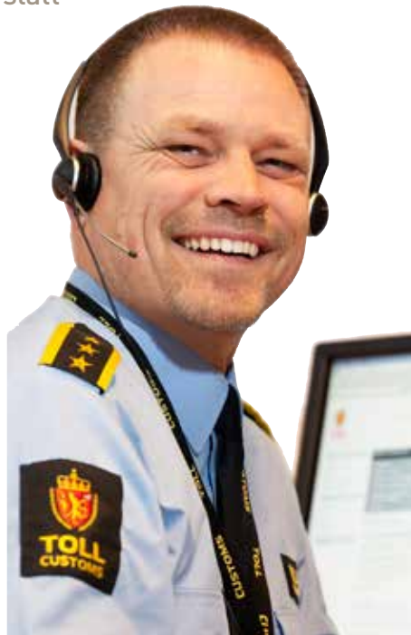
INFOSENTER: Det er travle dagar for tenestemennene ved infosenteret om dagen.

Det er rundt 7500 som tek kontakt med infosenteret kvar måned. ■