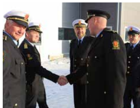
INVITERT: Det var flere inviterte gjester til åpningen.

For det er liten tvil om at den nye stasjonen betyr en helt ny hverdag for de ansatte. Regi-