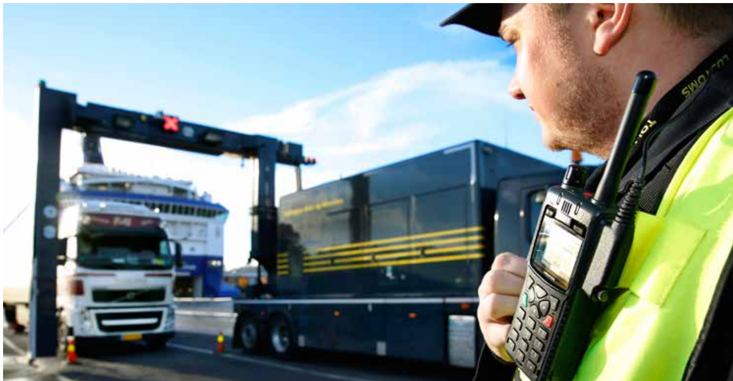
UTE OG INNE: Nødnett gjør kommunikasjon utenfra skanneren og inn i kontrollrommet enklare.