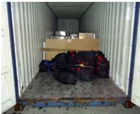
BESLAG: Programmet har ført til en rekke beslag over hele verden.