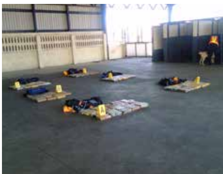
STANSET: CCP-enheten ved Puerto Quetzal i Guatemala har gjort dette beslaget.