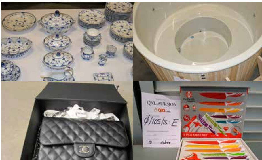
AUKSJON: Chanel-veske, knivsett, badestamp og servise var blant varene.