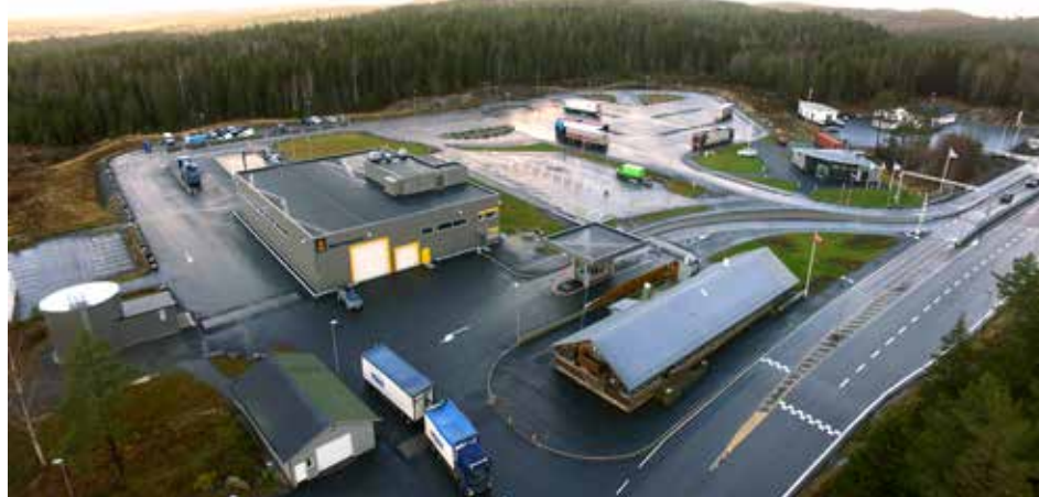
NY FASE: 1. januar 2016 går Toll- og avgiftsetaten inn i en ny tid, og endrer navn til Tolletaten.