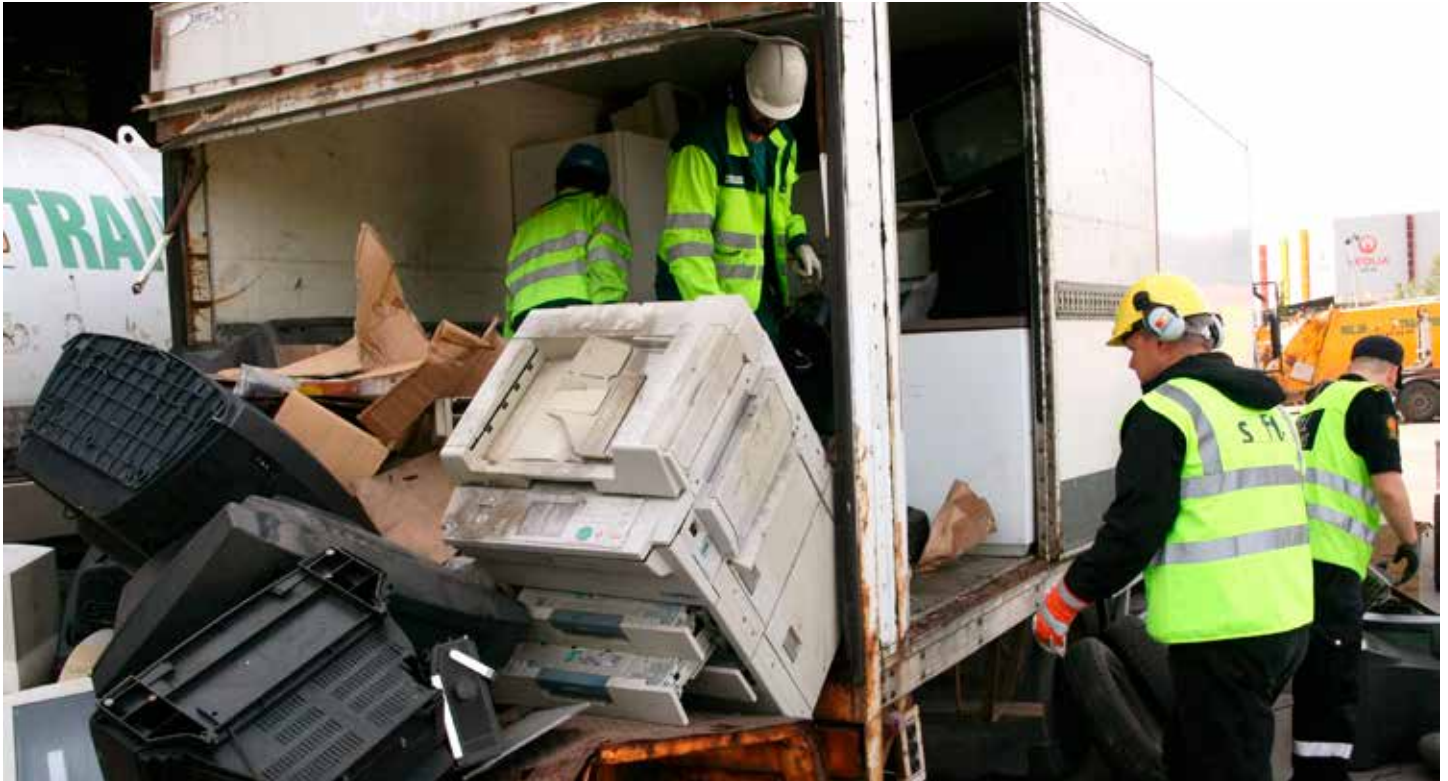
KONTROLLERER AVFALL: Kontroller av avfall foregår ofte i samarbeid mellom Miljødirektoratet og Tollvesenet. Her fra en samarbeidsaksjon i 2009.