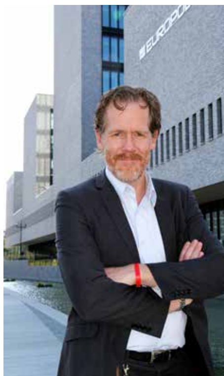
STORT LIASONNETTVERK: Europol er verdens største liasonnettverk samlet under ett tak. Europolbygningen ble åpnet våren 2012.