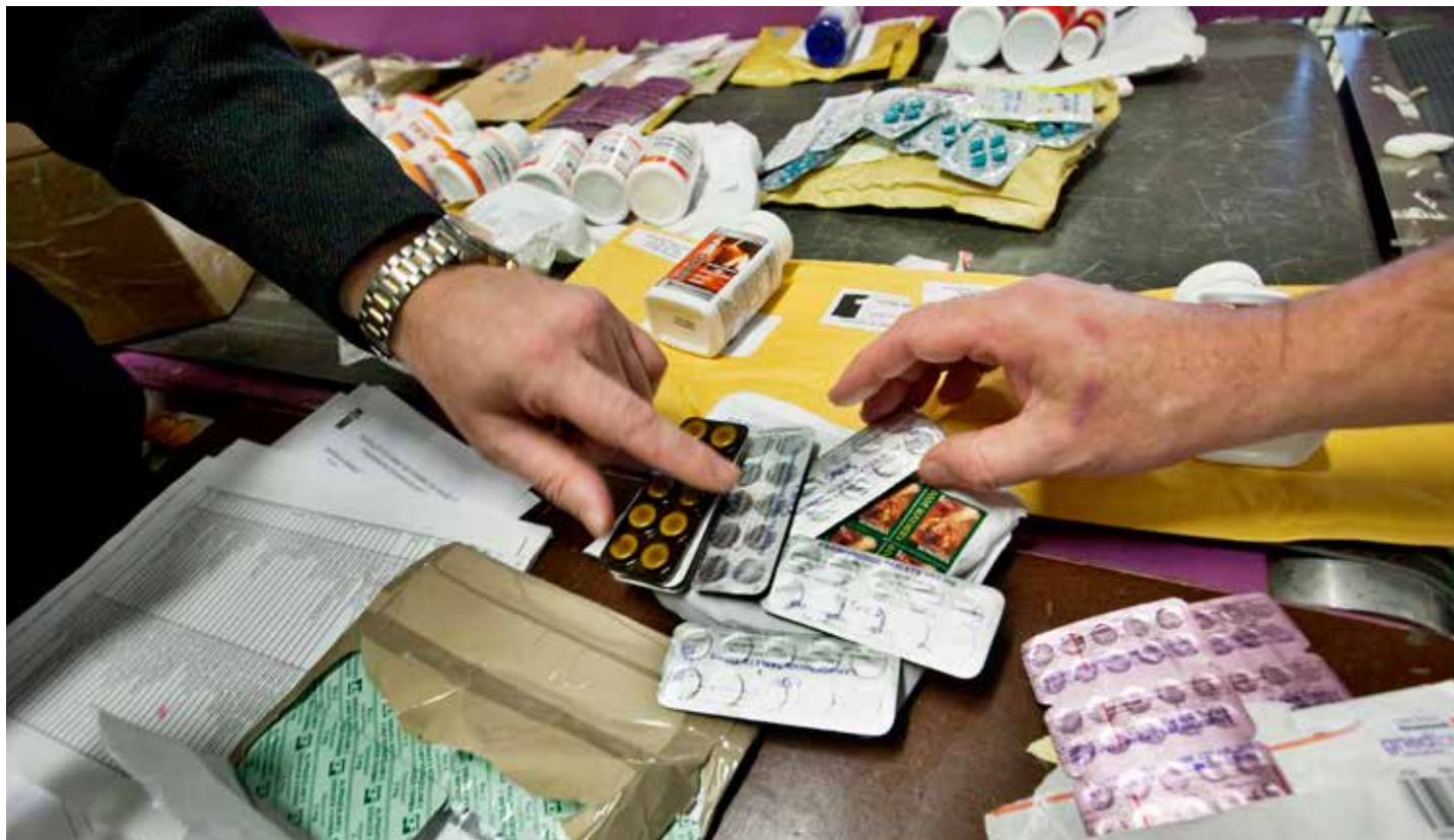
ULOVLIGE LEGEMIDLER: Det skal nå bli enklere å beslaglegge og destruere falske og ulovlige legemidler. Legemidlene kommer ofte i postforsendelser.