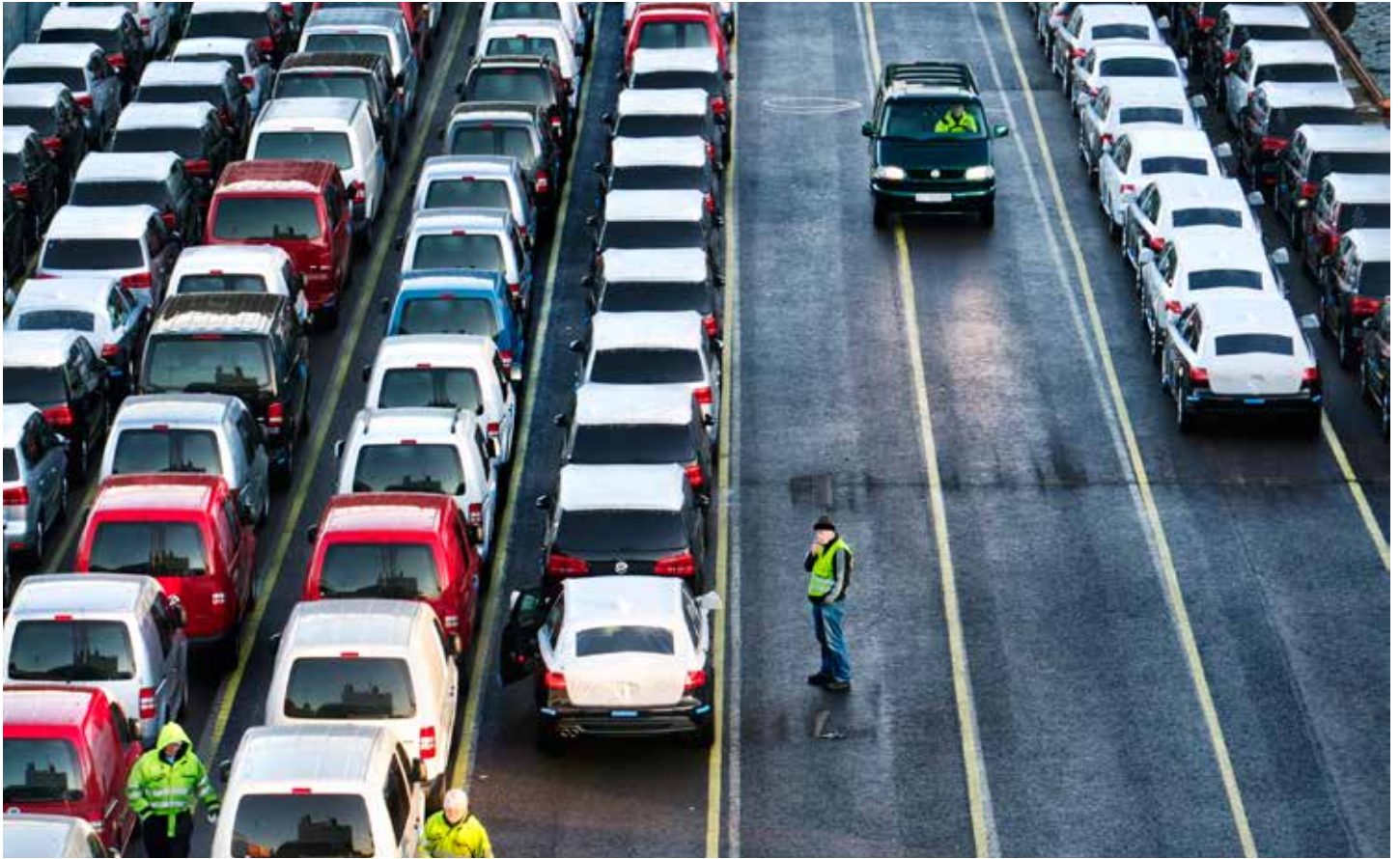
MOTORVOGNAVGIFTER: Engangsavgift og omregistreringsavgift er blant oppgavene som er foreslått flyttet fra Tollvesenet til Skatteetaten.