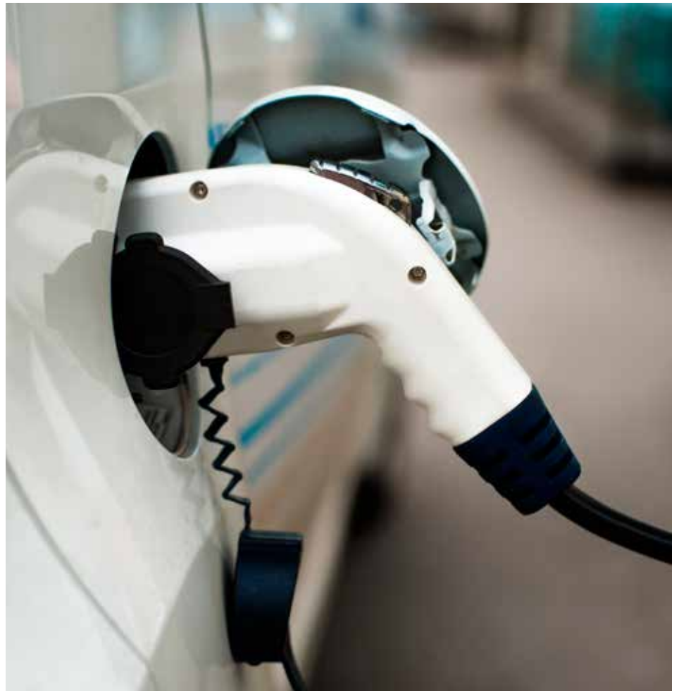
FLERE EL-BILER: Inntektene fra engangsavgiften er redusert med 1,1 milliarder kroner til 9,5 milliarder. Dette som følge av den markante økningen i nye personbiler med el-motor.

For omregistreringsavgiften er det en nedgang på 88,9 millioner kroner (8,9 prosent), mens årsavgift og vektårsavgift har økt med henholdsvis 320,7 millioner (3,4 prosent) og 16,7 millioner (10,3 prosent).