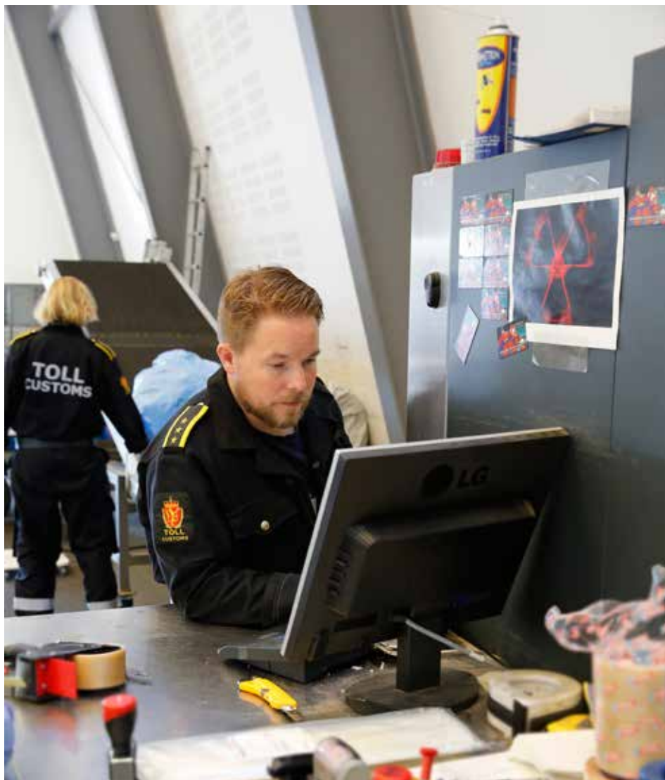
BLIR GJENNOMLYST: All posten blir gjennomlyst i en røntgenmaskin. Det er en jobb som krever erfaring og kunnskap, man skal vite hva man ser etter.

– Til gjengjeld vet vi mye om hvor narkotikaen kommer fra. Vi vet en god del om hvem som er avsendere og vi vet noe om hvem som er mottakere. Vi gjør et grundig forarbeid basert på risikovurderinger og etterretning før post og gods kommer til landet, slik at vi vet hva vi ønsker å kontrollere, sier Kristiansen.