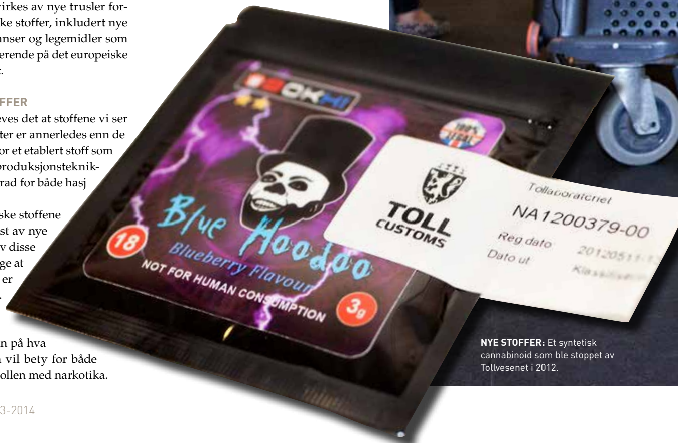
NYE STOFFER: Et syntetisk cannabinoid som ble stoppet av Tollvesenet i 2012.

Rapporten omtaler for øvrig også narkotikabruk og narkotikarelaterte problemer, helsemessige og sosiale tiltak mot narkotikaproblemer og narkotikapolitikk. ■