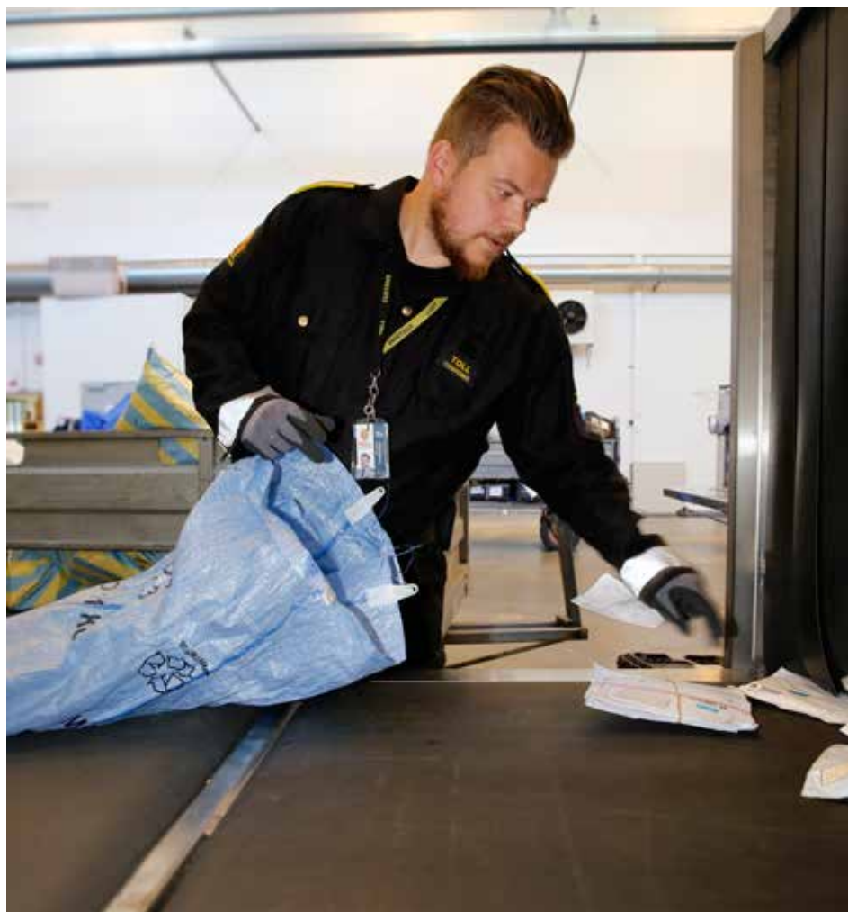
STYRKET KONTROLL: Flere post- og pakkeforsendelser passerer grensene på grunn av økende internetthandel, og det kan være ett av flere satsingsområder for Tollvesenet.

– Det er viktig å ha tjenestemennene i toll-regionene med i arbeidet. Det er de som vet hvor skoen trykker og kan hjelpe oss med å prioritere tiltakene riktig.