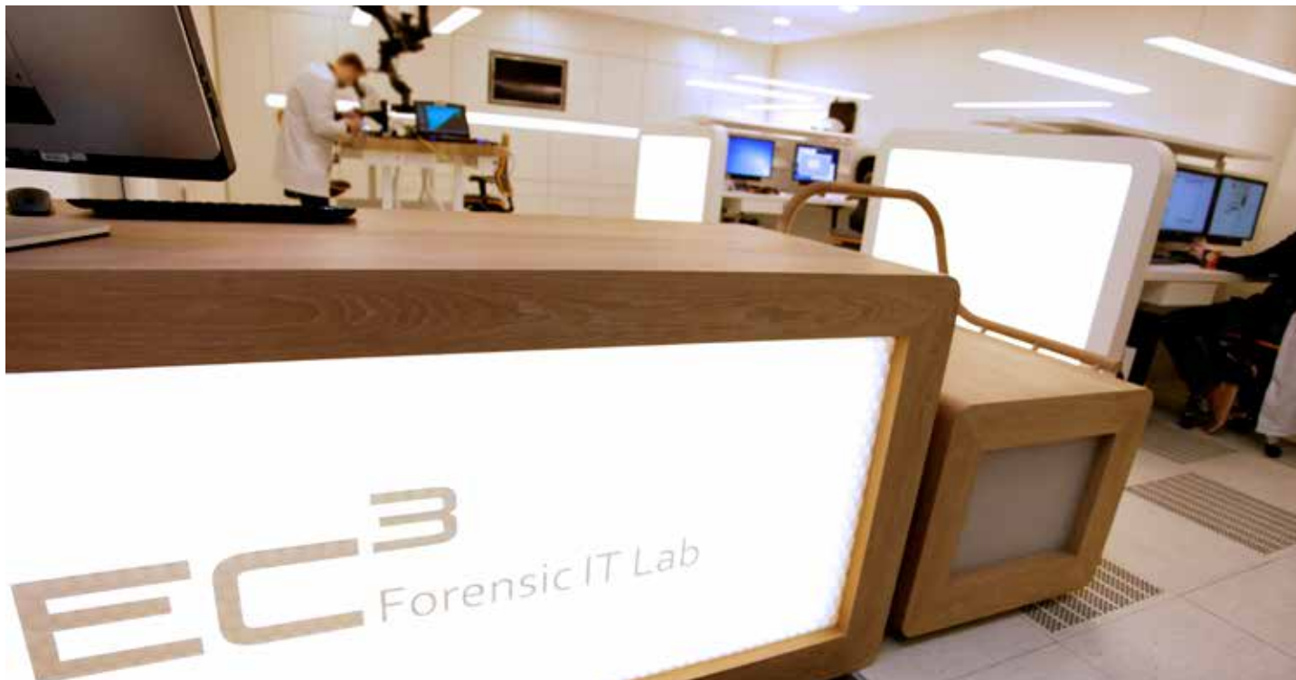
IT-LAB: Europol har oppretta ein digital kriminalteknisk IT-lab som skal støtte etterforsking i Europol-landa. Laben tilbyr innovative løysingar for å finne igjen og analysere informasjon frå digitale einingar, PC-ar og andre digitale lagringsmedium.