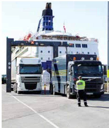
Ny skanner: Skanneren til Tollregion Oslo og Akershus, som har vore i bruk sidan våren 2012.

– Skannaren som no blir skifta ut, blei opphavleg stasjonert på Ørje, men har sidan 2009 hatt Grenland tollstad i Brevik i Telemark som base. Den nye mobile skannaren skal òg leverast i Brevik, men han er operasjonell i heile Tollregion Sør-Noreg. Også Tollregion Vest-Noreg skal kunne bruke han ved behov. Seks skannaroperatørar står klare til å ta nyskaffinga i bruk hausten 2015. Skannaren har kapasitet til å skanne 20–25 vogntog i timen. Han er eit uvurderleg hjelpemiddel i kontrollen av tyngre kjøretøy med gods som